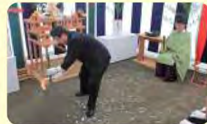
早川院長神事での一場面