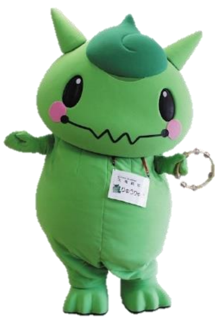
天竜病院マスコット りゅうりゅうくん