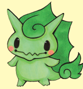
りゅうりゅうくん

明けましておめでとうございます。 新しい年がやってきました。今年はどうのような年になるのでしょうか。 2024年の漢字は「金」でした。4年周期で選ばれている感否めませんが、今年に限っては「金」を「きん」と読むか「かね」と読むかで思い出すニュースの印象が真逆になります。同じ漢字なのに不思議ですね。 2025年は誰にとってもいいニュースで振り返れる年になって欲しいなと思っています。