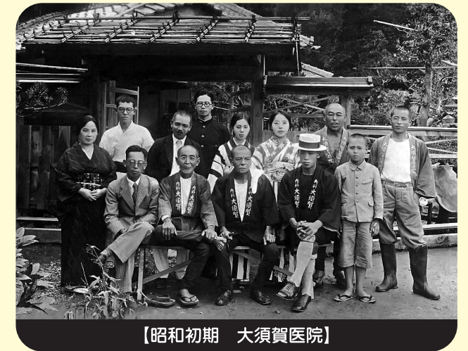
【昭和初期 大須賀医院】

磐田市(豊岡地区)の大須賀医院です。日頃より天竜病院の皆様には呼吸器科や神経内科をはじめ、多岐にわたり紹介患者さまの迅速な対応をしていただき、感謝しております。当院は磐田市(旧豊岡村)で明治、大正、昭和、平成、令和と、曾祖父の代から地元での診療所を継承しております。現在私の代では、糖尿病、高血圧症、脂質異常症などの生活習慣病や甲